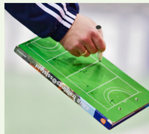
Zet je in de wedstrijd de kwaliteiten van spelers optimaal in?

De taak – bijvoorbeeld het aansturen van de achterhoede – mag zeker niet te makkelijk en net niet te moeilijk zijn. Zo voorkom je dat de speler naar de status van respectievelijk verveling of angst schiet. Flow is de beleving van deze optimale ervaring, waarbij de aandachtsspanne het grootst is. In een flow gaat alles vanzelf en gaat bovendien het tijdsbesef verloren.