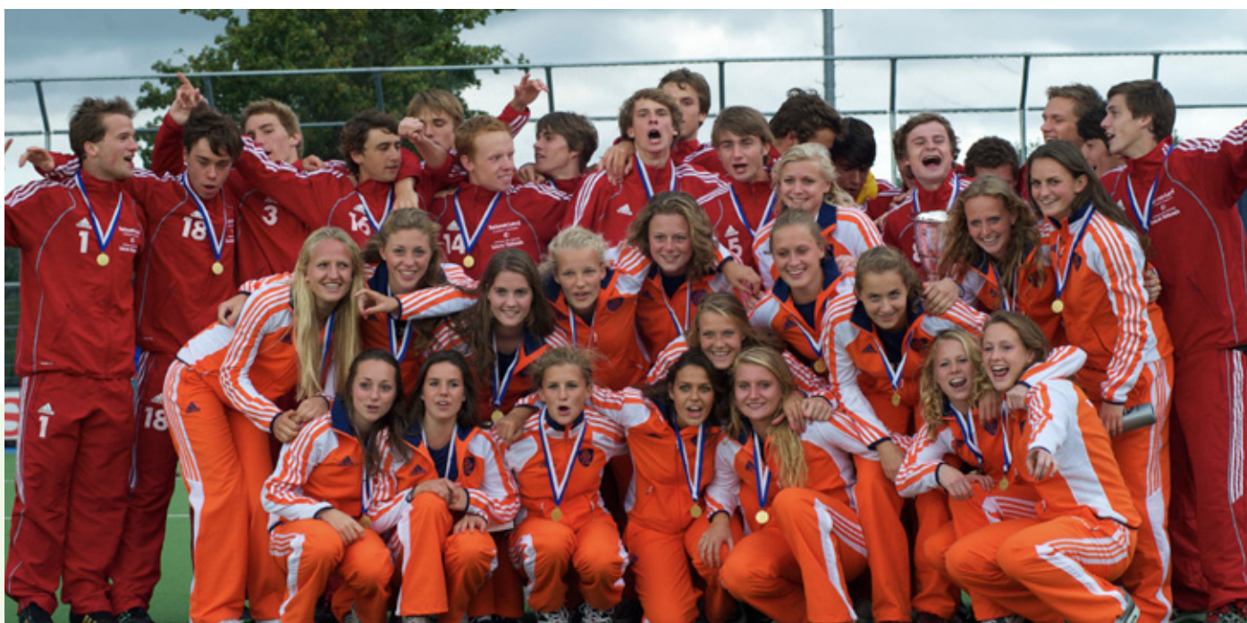
Sociale verbondenheid gaat over grenzen heen, zo tonen de speelsters van Nederland Meisjes A en hun Belgische leeftijdgenoten op het EK in 2011.

water op te zuigen; dat staat in dit geval voor leren en ontwikkelen. Coaches zouden volgens Ryan en Deci ervoor moeten zorgen dat hun spelers zoveel mogelijk 'water' kunnen opzuigen en dat niets hen daartoe in de weg staat.