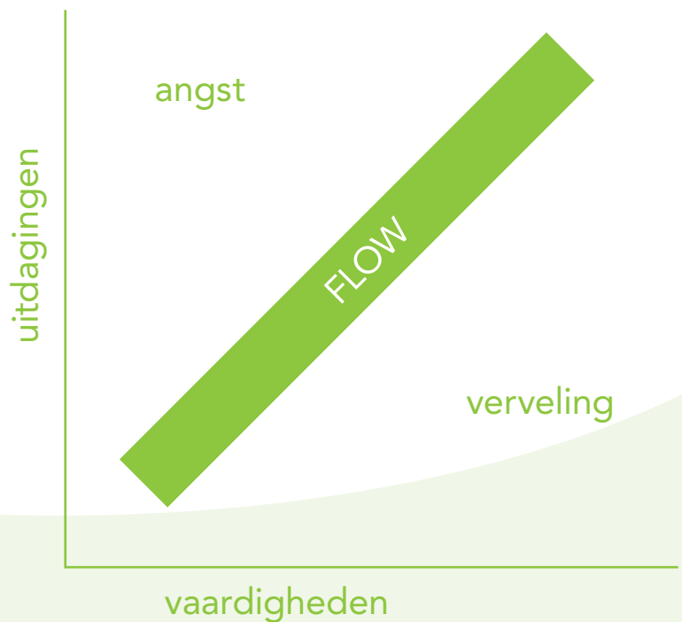
Figuur 3: De optimale ervaring als flow weergegeven (Csikszentmihalyi, 2007).