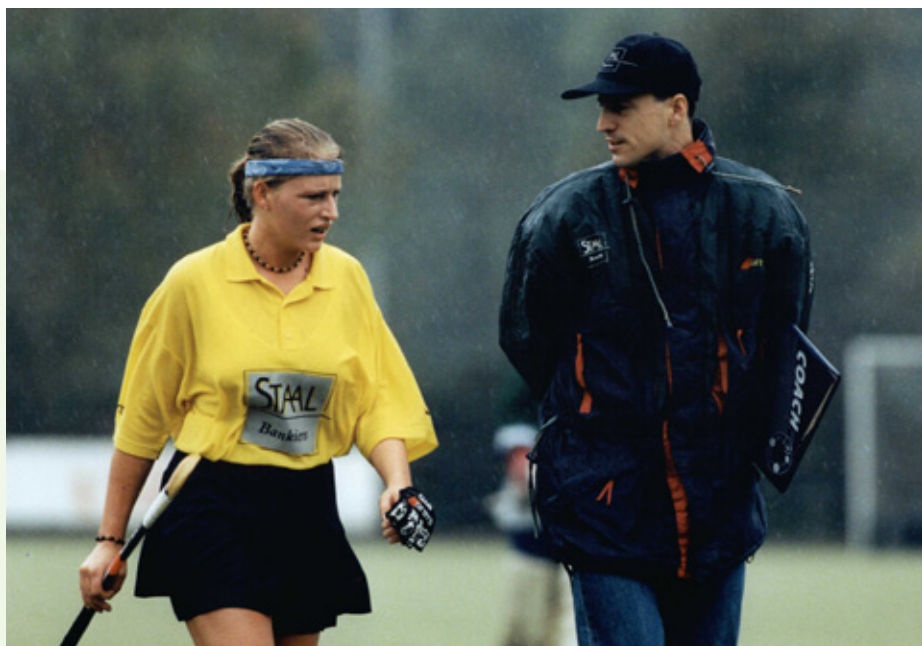
Als coach moet je je ogen en oren openzetten.

Gemotiveerde hockeyers zijn bereid zich in te zetten voor een taak, een activiteit